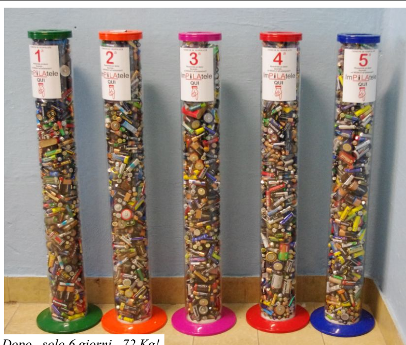
Dopo...solo 6 giorni...72 Kg!

Un ringraziamento alle famiglie che hanno supportato i propri figli in questa raccolta, al dirigente scolastico che ne ha permesso la realizzazione, alle insegnanti che hanno seguito i ragazzi a scuola, e naturalmente il più grande ringraziamento va ai bambini , che hanno risposto all'invito con: una carica di energia che ci auguriamo.....non si esaurisca mai!