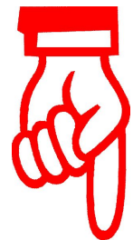
Pronti per la "raccolta"!